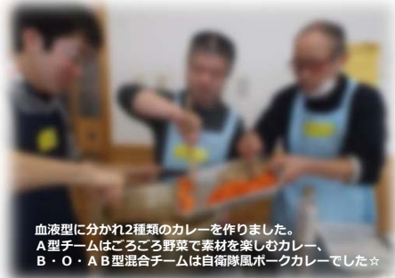
血液型に分かれ2種類のカレーを作りました。 A型チームはごろごろ野菜で素材を楽しむカレー、 B・O・A B型混合チームは自衛隊風ポークカレーでした☆