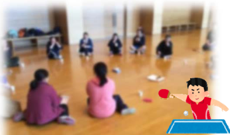
休憩時には冬のおやつ定番・あじまんを皆で食べました。「あんこかクリームか」で話題となり、りらとこメンバーにはクリーム派が多かったです。